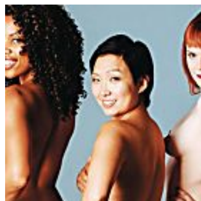
Naakte lijven met een bijzonder verhaal: 'Ik schaam me niet'