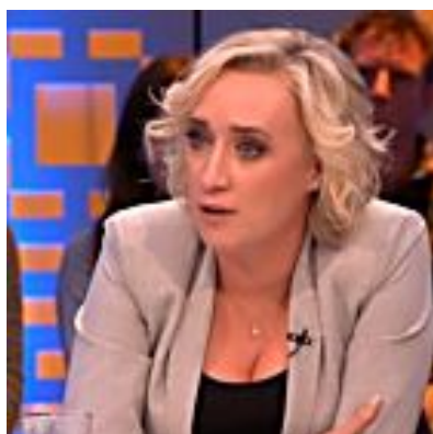
Eva Jinek in tranen: 'Jullie zijn nog zo lief met elkaar'